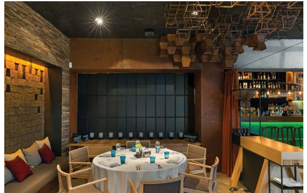
В интерьере сочетаются элементы многих современных стилей: конструктивизма, минимализма, экостиля